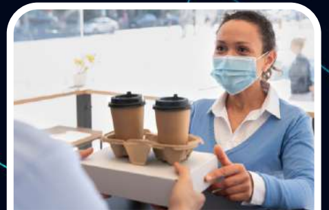
Sağlık / Health