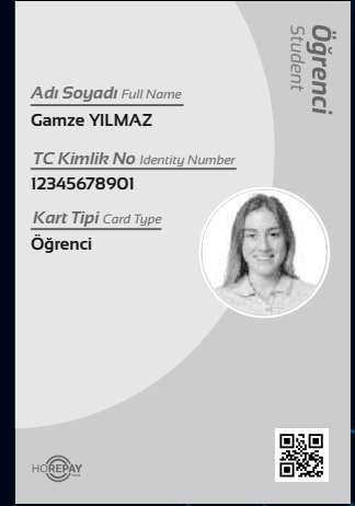
Kişiselleştirilmiş Kart Örneği Personalized Smartcard Sample

You can personalize smart cards from your card distribution office and deliver them instantly, without the need for long processes such as card printing, shipping and delivery.