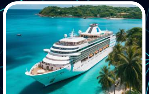
Turizm / Tourism