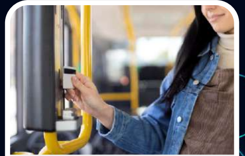
Ulaşım / Public Transport