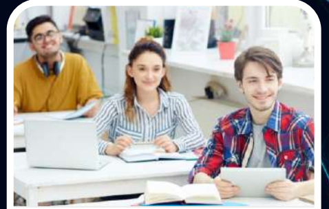
Eğitim / Education