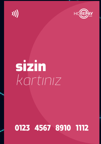
Standart Kart Örneği (Kişiselleştirilmemiş) Non-Personalized Smartcard Sample