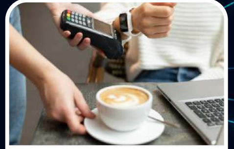
Perakende / Retail

Horepay, which emerged within the scope of this project, has become an actively used solution in the Retail, Education, Transportation, Health, Entertainment and Tourism sectors today.